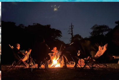
過去ツアー時の視察写真